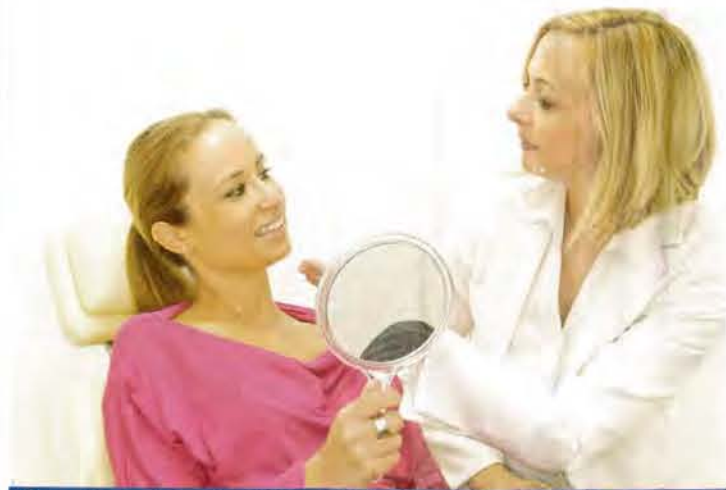
Ganz entspannt das Lächeln wieder lieben lernen: Love your smile

Jetzt einfach bequem für 5,90 Euro zzgl. Versandkosten bestellen. Fax: 040 / 27 17 - 20 64 | E-Mail: topguide-versand@prinz.de